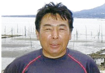
諫早湾漁協青壮年部

有明海を美しい海にもどすために、福岡県、佐賀県、長崎県、熊本県がひとつになって実施している海浜清掃。毎年、漁業関係者を中心に多くの人々が参加しています。改めて海の大切さを考え、未来にのこしていくために、みなさんのご参加をお待ちしています。