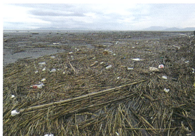
佐賀県 東与賀海岸