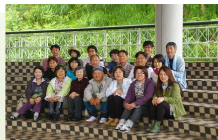
講師派遣、イベントへの出展、研修会、講習会の開催