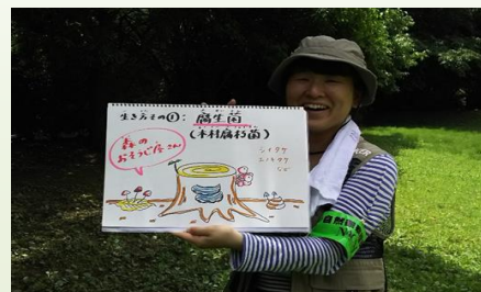
佐賀県内各地での観察会の開催